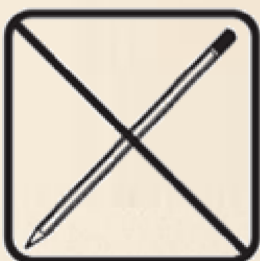
Crayons de bois